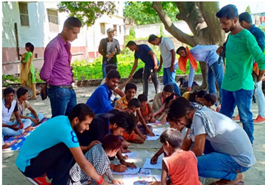
Students of L.N.D College, Motihari (NSS Volunteers) has actively participated in the NSS Special Camp to promote Cultural activities among Children by organising Painting Competition and Street Play