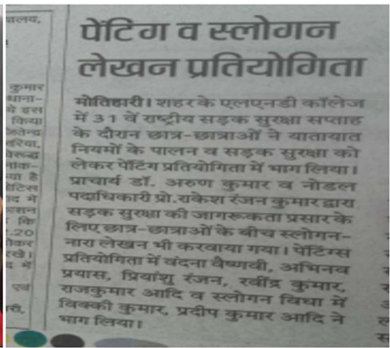
PAINTING AND ESSAY WRITING COMPETITION