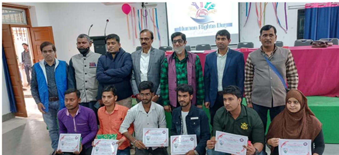
HUMAN RIGHTS DAY QUIZ COMPETITION PROGRAMME 2022