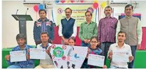
एलएनडी कॉलेज में आयोजित प्रतियोगिता में शामिल प्रतिभागी व अन्य।