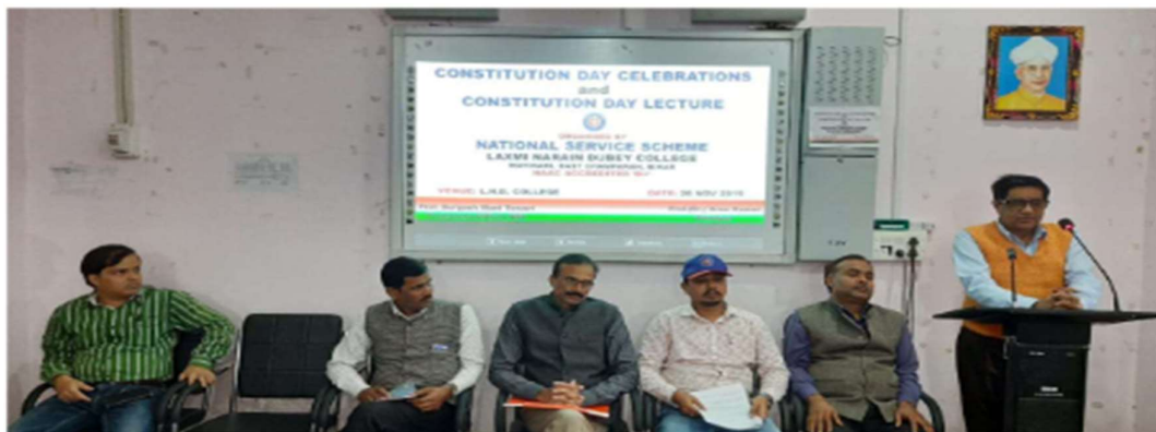
L.N.D College, Motihari has organised Constitution Day Lecture and Celebrate Constitution Day, 2019