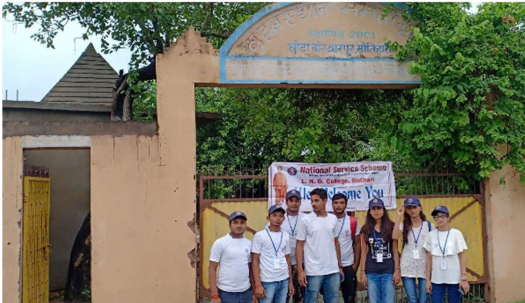
Interactions with resident of Balika Griha, Chota Bariyarpur