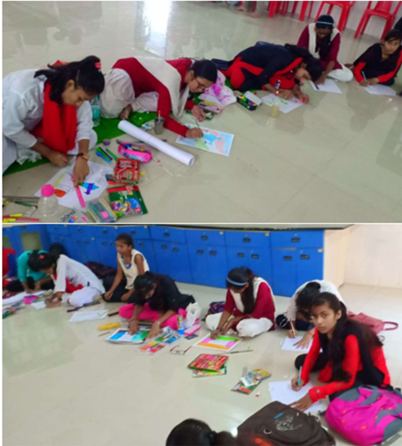
Students of L.N.D College, Motihari has participated in the selection process of ‘Spot Photography’ event on the theme “Swachhata in City” for the “TARANG”-2018-19